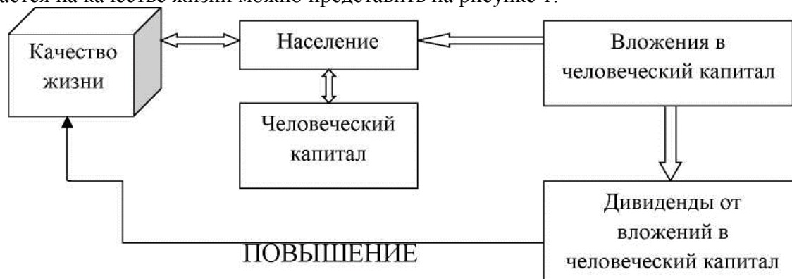
Рисунок 1 – Схема зависимости вложений в человеческий капитал и повышения качества жизни [24, с. 178]

Как происходит оборот инвестиций при их вложении в человеческий капитал, и как это отражается на качестве жизни можно представить на рисунке 1.